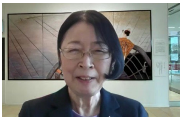
村木厚子選考委員長

5 期生の皆さんには 1 人ひとり自己紹介と将来の夢について語っていただき、この 3 月に卒業となった卒業生からは、学生生活の思い出や 5 期生への励ましの応援メッセージ、社会人となる抱負を語っていただきました。